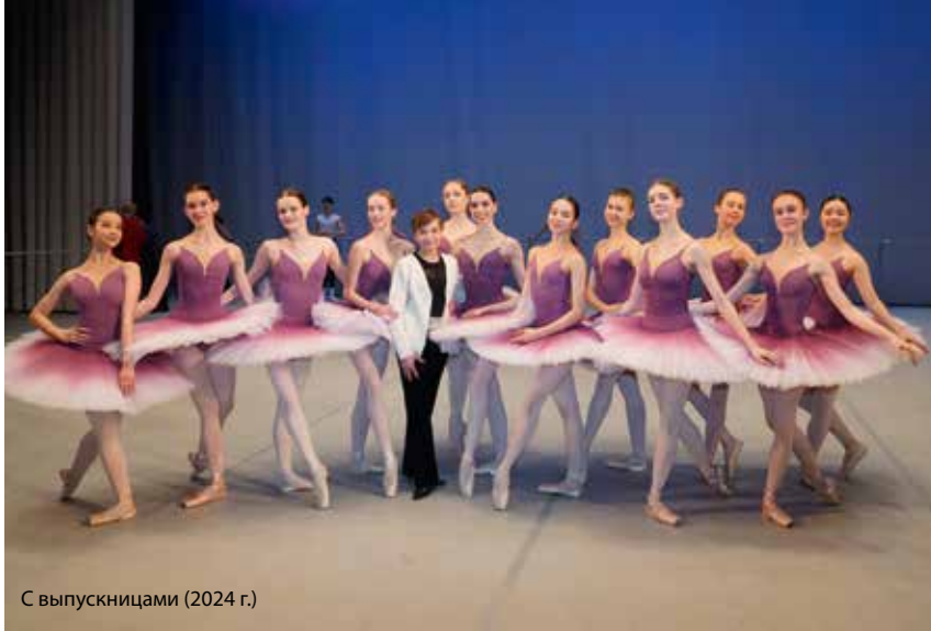
С выпускницами (2024 г.)